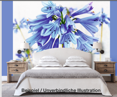
Beispiel / Unverbindliche Illustration